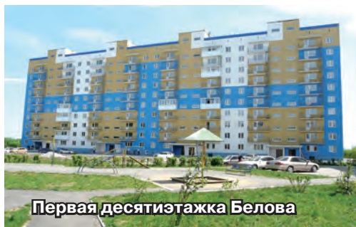
Первая десятиэтажка Белова