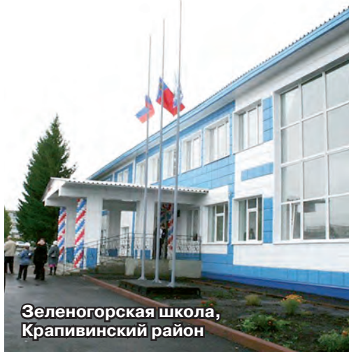
Зеленогорская школа, Крапивинский район