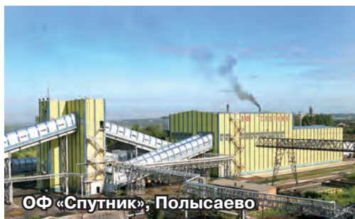
ОФ «Спутник», Полысаево