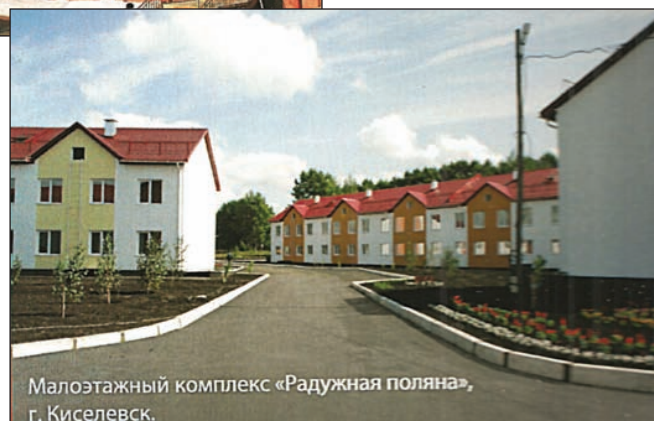
Малозэтажный комплекс «Радужная поляна», г. Киселевск.