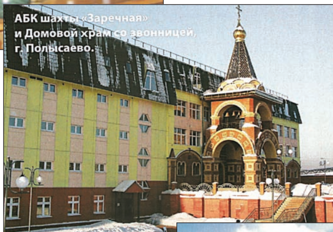
АБК шахты «Заречная» и Домовой храм со звонницей, г. Полысаево.

Беловчанам дано почетное право на базе дома отдыха «Жемчужина Кузбасса» (г. Салаир) во время летних сборов, на которые вот уже более десяти лет съезжаются люди со всего Сибирского региона, организовывать сдачу нормативов на присвоение коричневого пояса. Кроме Сибирского бранча (региона), таким правом обладает только Пермский бранч – центр карате России. Это несомненное признание заслуг наших тренеров!